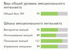
Рис. 4. Пример негармоничного профиля уровня эмоционального интеллекта

Респондентам, имеющим негармоничный профиль, рекомендуется пройти программу по развитию эмоционального интеллекта для того, чтобы улучшить коммуникацию в личных и рабочих задачах, а также повысить эффективность своей деятельности, снизить уровень профессионального выгорания, научиться выстраивать сбалансированный режим труда и отдыха.