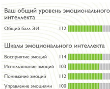
Рис. 1. Результаты теста эмоционального интеллекта Figure1. Emotional intelligence test's results

После прохождения теста, респондент получает свои результаты в виде шкалы с числовыми показателями уровня общего эмоционального интеллекта и четырех его способностей (рис.1).